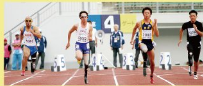
◀ 同じ競技区分の選手で競技

陸上競技には、競走種目、跳躍種目、投てき種目があり、障害区分や年齢区分を設け、同じ区分の選手同士で競技をします。