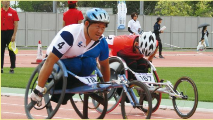
▲競技用車いす(レーサー)