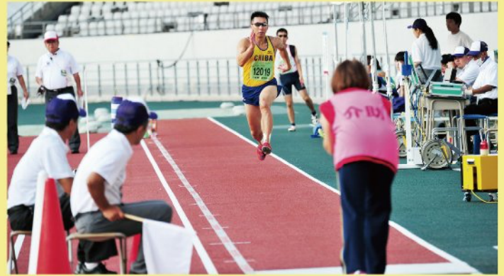
▲手をたたいた音で、踏切の位置を知り、ジャンプ!