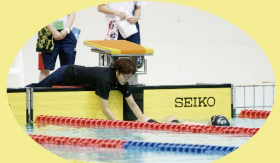
▲脚を支えてスタート